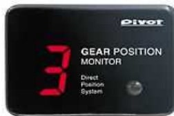
ギアポジションモニター GPM-R 照明色 7セグ表示=赤 価格 ¥10,290(税込) (本体¥9,800)

赤色表示のGPM-Rと青色表示のGPM-Lの二種類をラインアップ、インテリアに合わせてどうぞ。