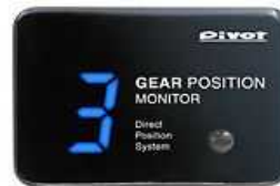
ギアポジションモニター GPM-L 照明色 7セグ表示=青 価格 ¥12,600(税込) (本体¥12,000)

美しいスケルトンデザインの採用により、表示はブラックケースから浮かび出ます。 高さ16mmの大型LED表示を採用し、調光機能(明るさ調整)付きで見やすい表示です。 51(W)×35(H)×22(D)mmと小型な本体サイズで様々な場所に装着が可能です。