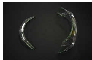
GP-PED (Performance Enhancement Device)同梱

四輪用ヘルメット「GP-6」新登場。 F-1でも使用されているGP-6 RCと同形状の帽体 を実績のあるSuper-cLc構造とし、SNELL SAH2010をクリアする安全性能を実現。 万一の際にもシールドを保持するレーシングロックや、新 たに頬パッドを脱着可能とし、メンテナンスやサイズ調整 を容易としたほか、ヘルメットアンカーの取り付けが可能 なM6ターミナルの標準装備※、GP-PEDの同梱など、 プロスペックにふさわしい機能を備えたヘルメットです。 ※別途M6ターミナル対応ヘルメットアンカーが必要です。