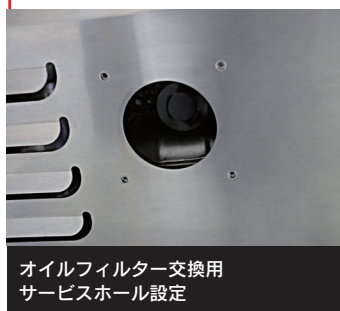
オイルフィルター交換用 サービスホール設定