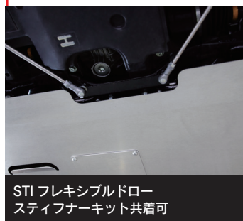
STI フレキシブルドロ スティーパーキット共着可