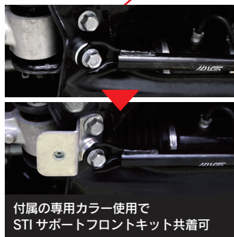
付属の専用カラー使用で STI サポートフロントキット共着可