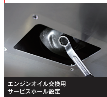
エンジンオイル交換用 サービスホール設定