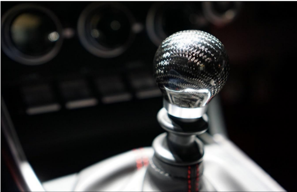
【カーボンシフトノブ】