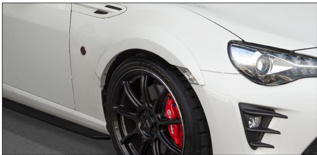
【オーバーフェンダー（フロント）】