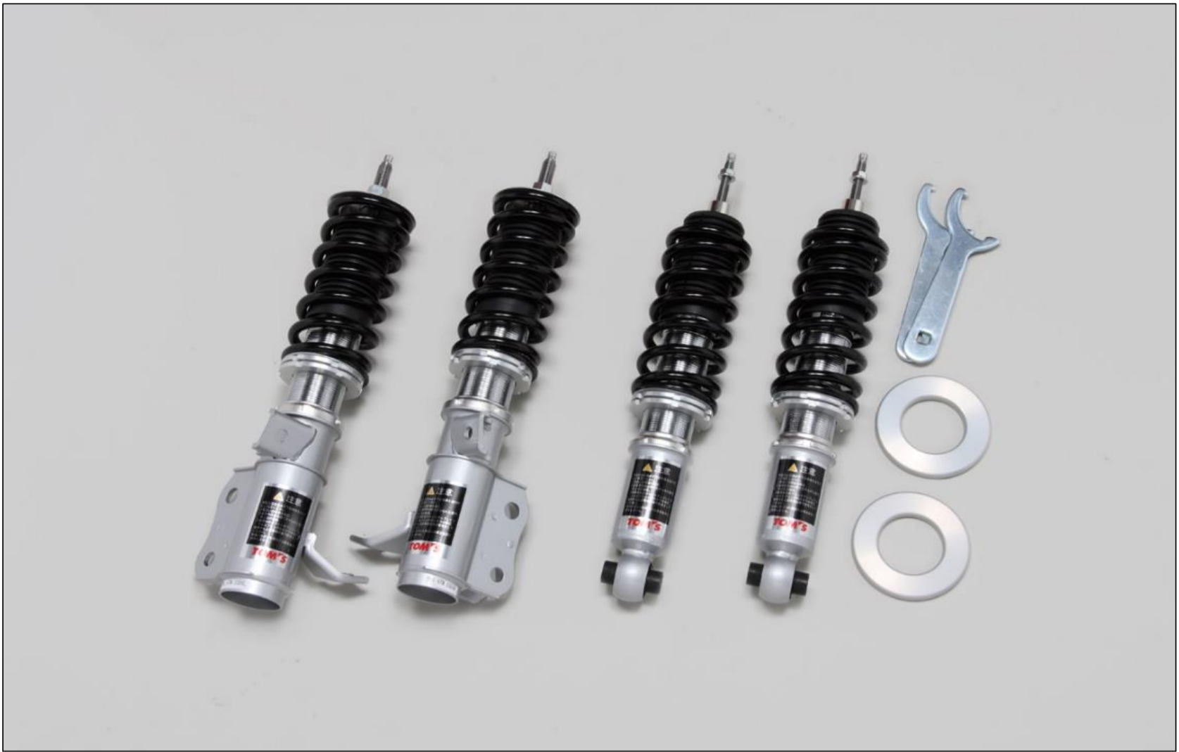
【スポーツサスペンションキット】