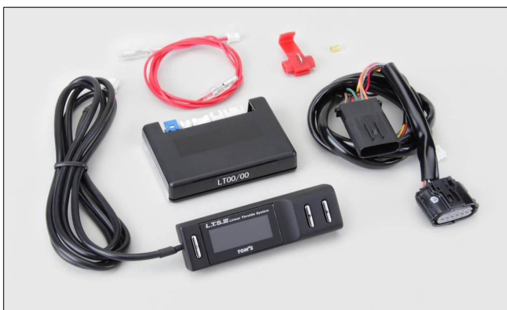
【電子スロットルコントローラ「L.T.S.Ⅲ」】