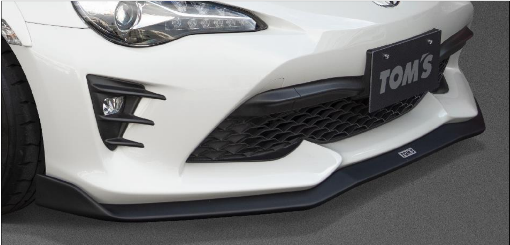
【フロントディフューザー"Sport"】