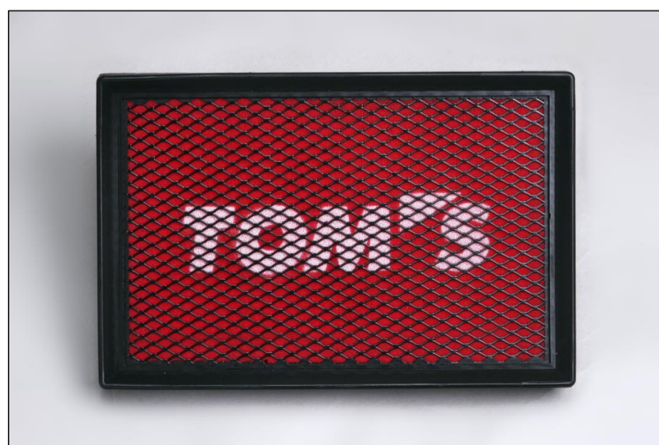
【エアフィルター「スーパーラムストリートⅡ」】