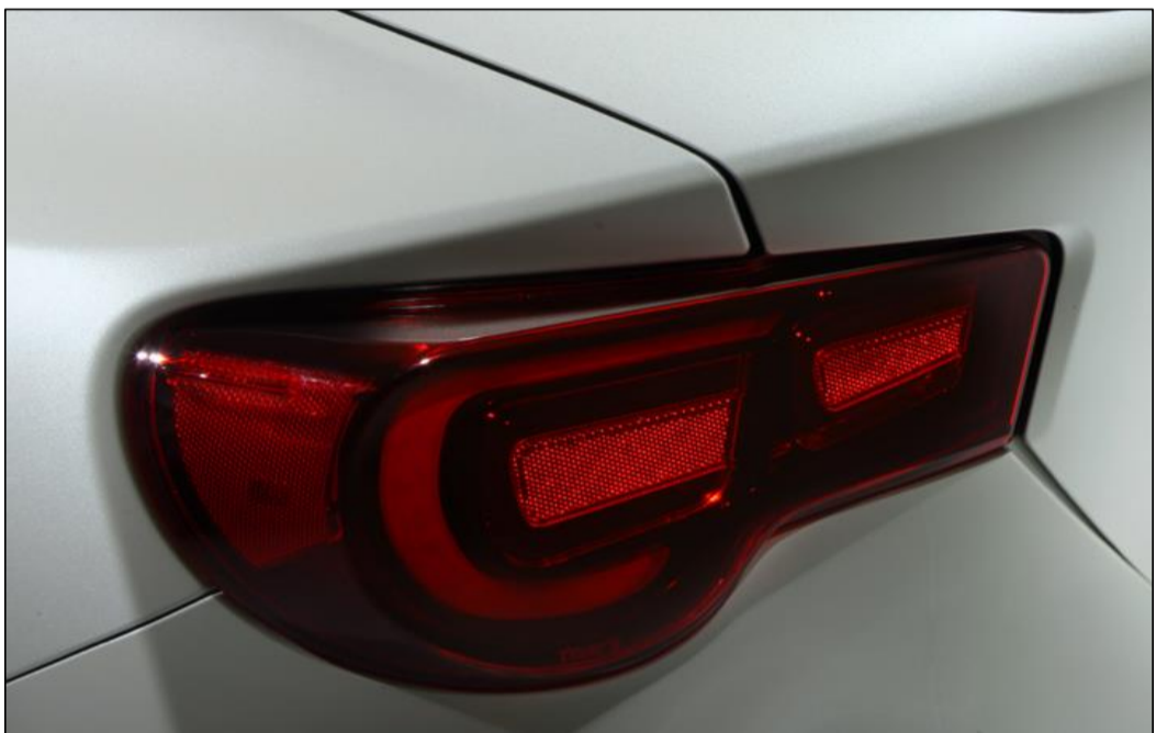
【LEDテールランプ（復刻モデル）】