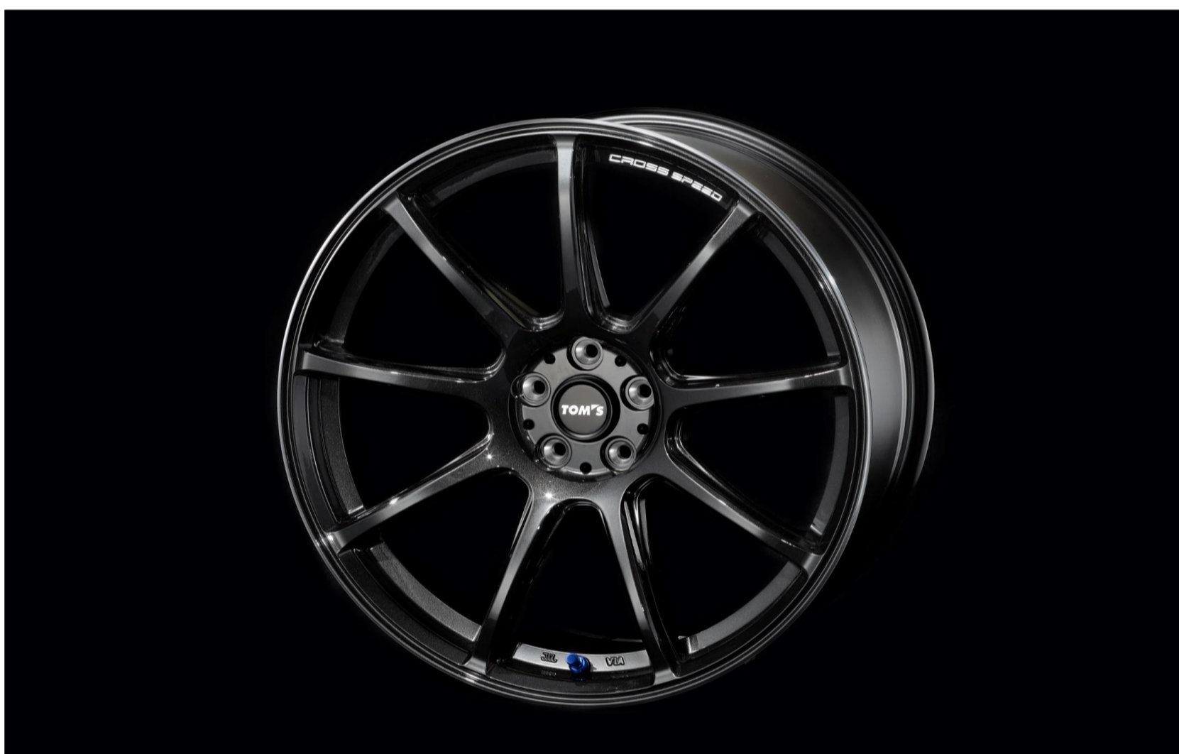
【18インチアルミホイール「TOM'S CROSS SPEED」18x7.5J +45 5H/100】