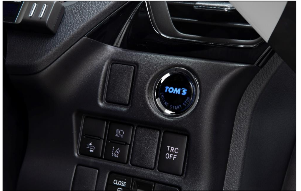
【プッシュスタートボタン】