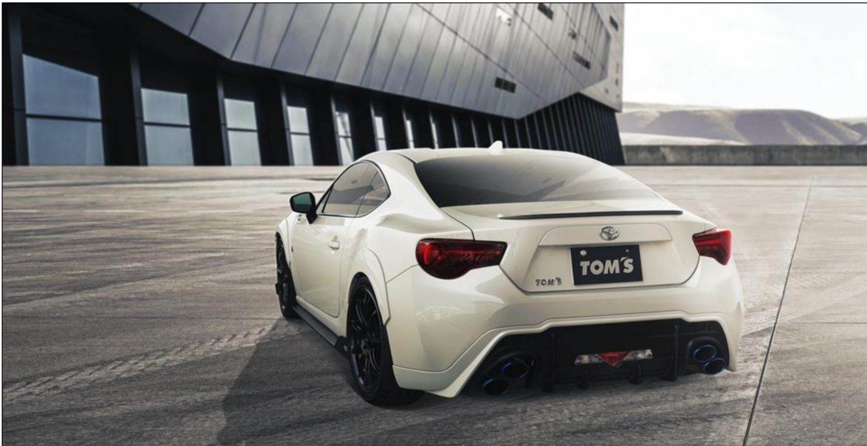
【TOM'S 86 (ZN6 KOUKI)】