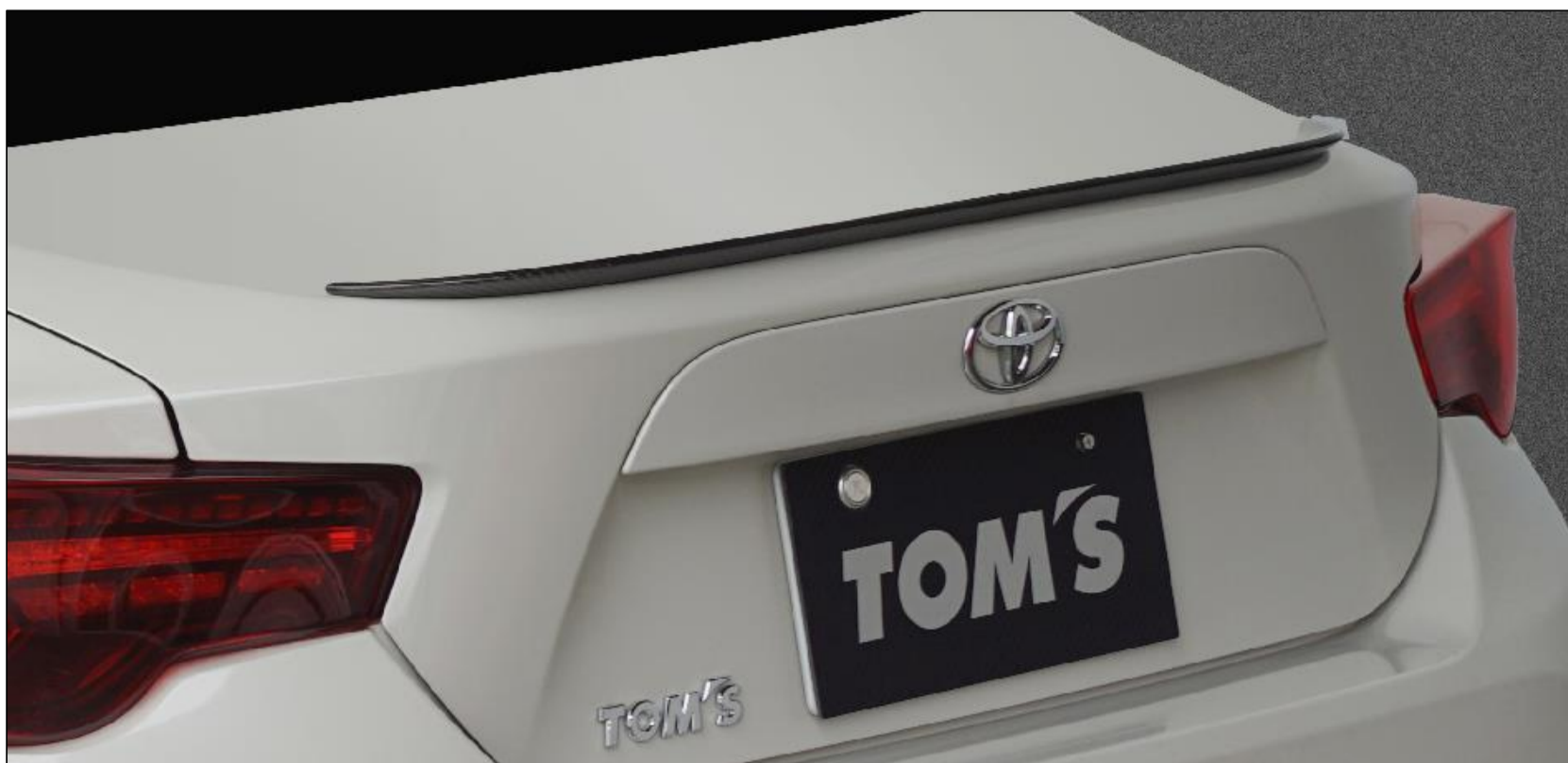
【トランクリッドスポイラー】