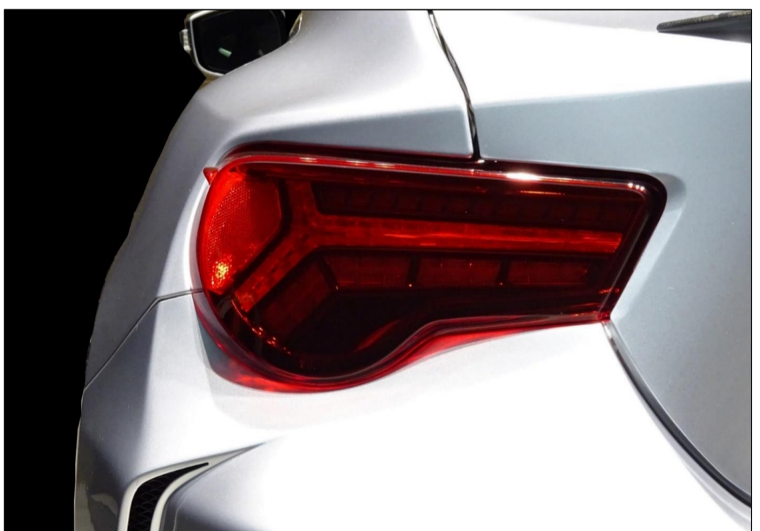
【LEDテールランプ・シーケンシャル】