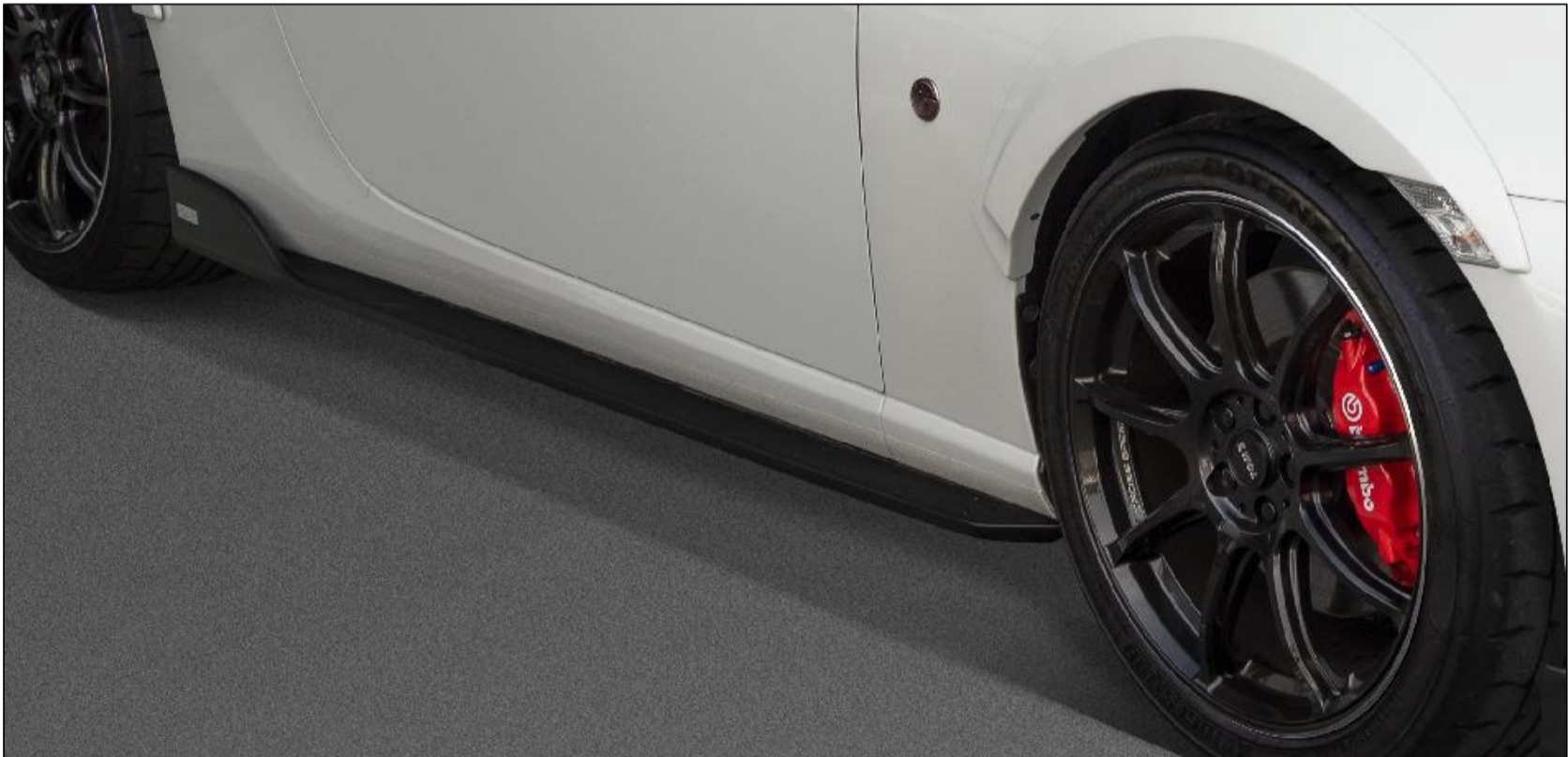
【サイドディフューザー】