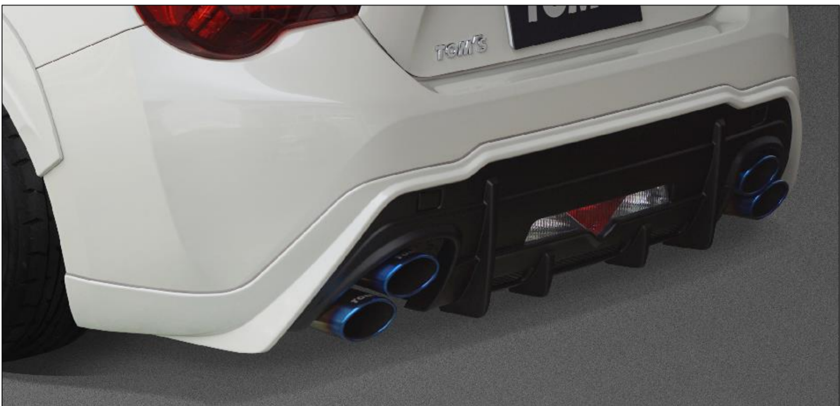
【リヤアンダースポイラー"Sport" & エキゾーストシステム「トムス・バレル」】