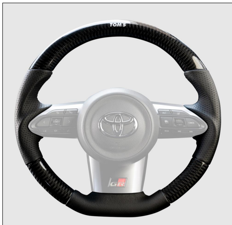
【TOM'S カーボンステアリング】

リアルカーボンと高級ナッパレザーの組み合わせがスポーティ&エレガントな雰囲気を演出。グリップ部にはパンチングレザーとガングリップ形状を採用し、手に馴染みやすく快適なドライビングを実現します。